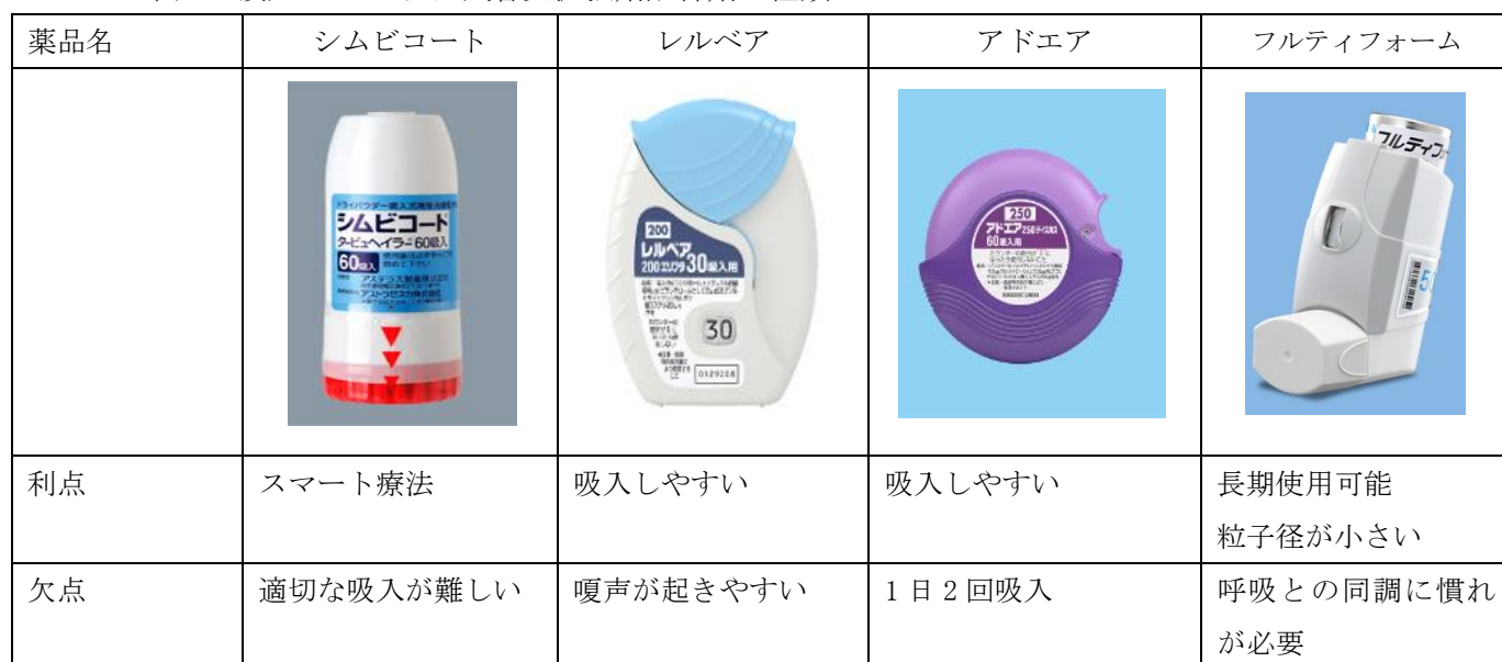
表1 吸入ステロイド/気管支拡張剤配合剤の種類

シムビコートはスマート療法として定期吸入と必要時吸入を1剤で可能だが、シムビコート以外では、必要時吸入としてサルタノールやメプチンエアーなどの併用が必須となります。